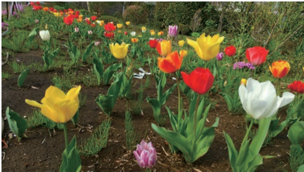
六角堂のチューリップ及びサクラソウ（P6）