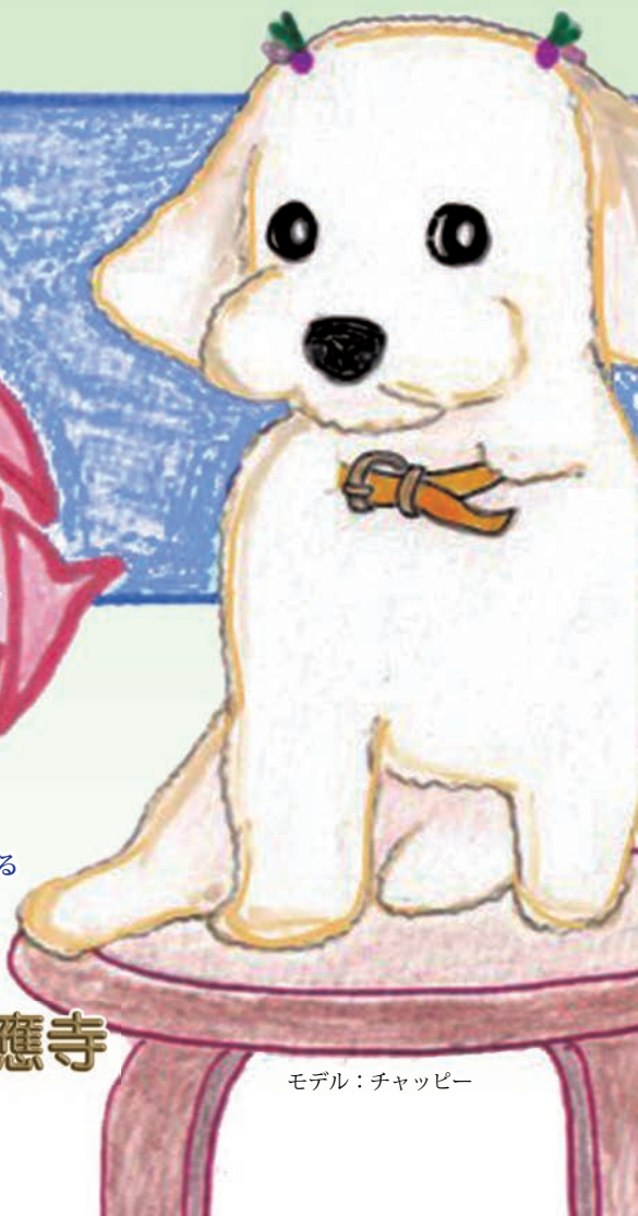
モデル：チャッピー